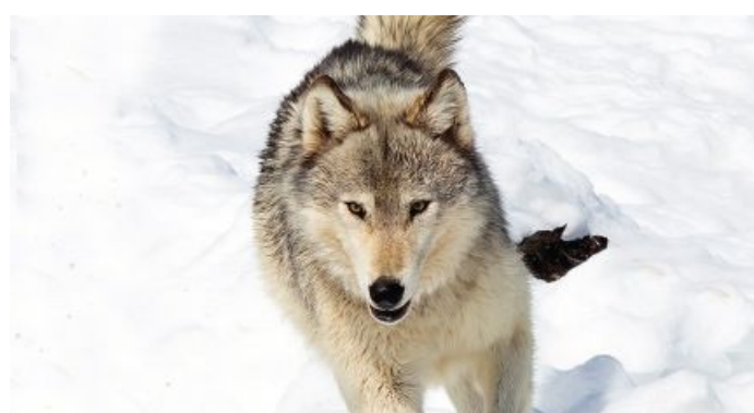
Ein Risikowolf im Bezirk Landeck ist zum Abschuss freigegeben.

Die Nachweise erfolgten im Gemeindegebiet von See im Paznaun. Einmal wurde das