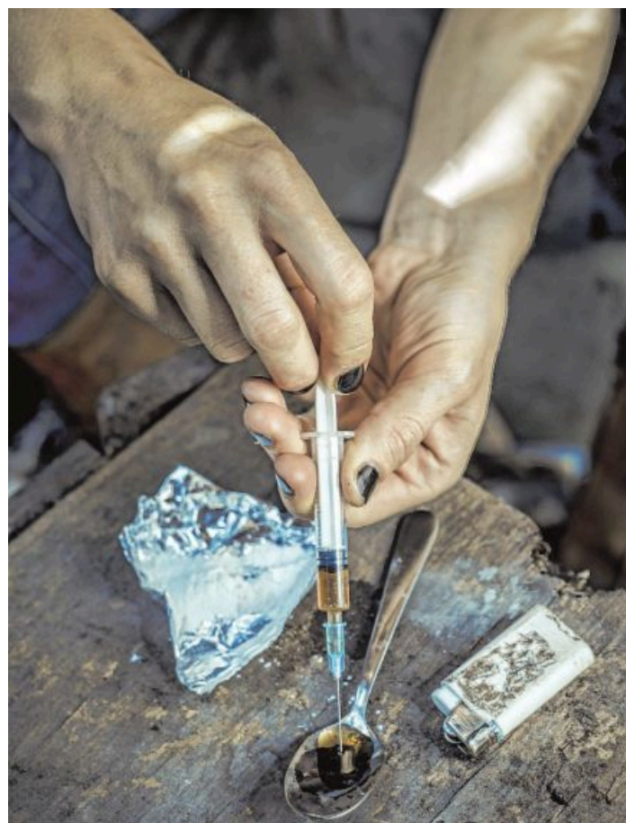
17 Minderjährige, die intravenös Drogen konsumieren, wandten sich 2025 an die Beratungsstelle Z6. Alle waren Mädchen (Symbolfoto).