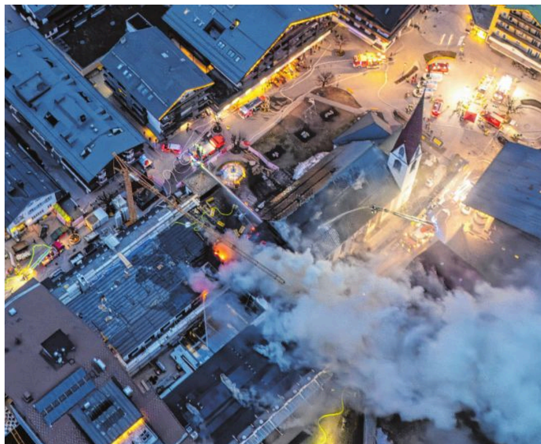
Beim Großbrand des Hotels Klosterbräu in Seefeld am Montag wurden alle mit empfangsbereitem Handy mit AT-Alert über die mögliche Gefahr für die Bevölkerung informiert.

Das System wird laufend weiterentwickelt, verbessern will man laut Geiler u. a. „die räumliche Empfangsgenauigkeit“, denn noch kann es vorkommen, dass bei Handys, die nur an das betroffene Katastrophengebiet angrenzen, Alarm ausgelöst wird. Gemeinsam mit dem Bund sind noch heuer einige Neuerungen geplant, kündigt Geiler an. Dazu gehört, dass die Warnungen auf den Öffi-Fahrbahnauskunftstafeln und in den Öffis ersichtlich sind und „die Wiedergabe der Warnnachricht über Digital-