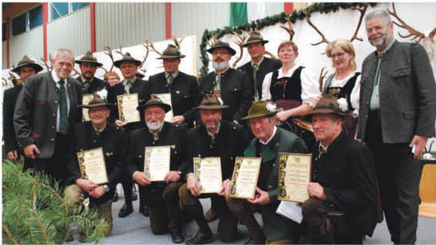
Die Bezirkstrophäenschau bot den passenden Rahmen für die Ehrung von zehn Jagdhornbläsern.