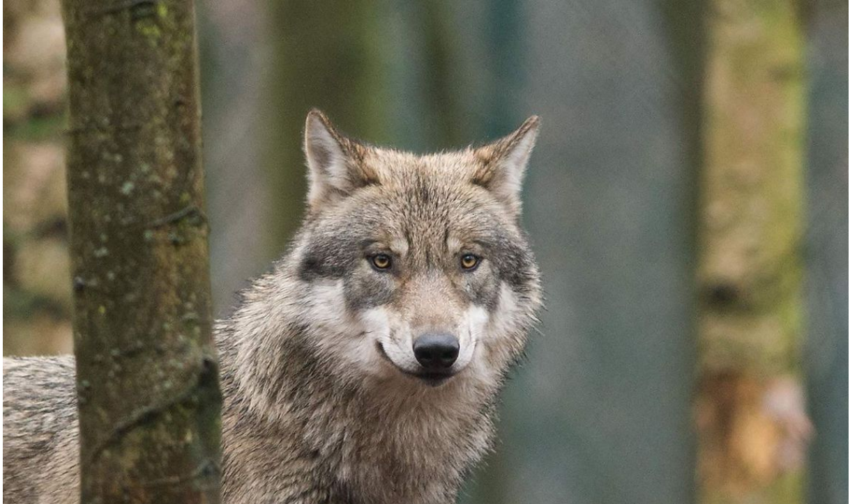
Archivbild: Ein Wolf in einem deutschen Zoo

Der Tiroler Jägerverband will sich nicht den "schwarzen Peter zuschieben" lassen.